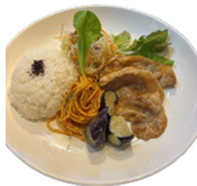
シェフの気まぐれランチ 500円