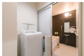
受け入れをしている 家族用シェルターの写真