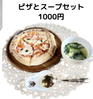
ピザとスープセット 1000円