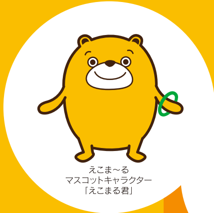
えこま〜る マスコットキャラクター 「えこまる君」