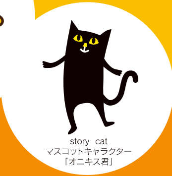
story cat マスコットキャラクター 「オニキス君」